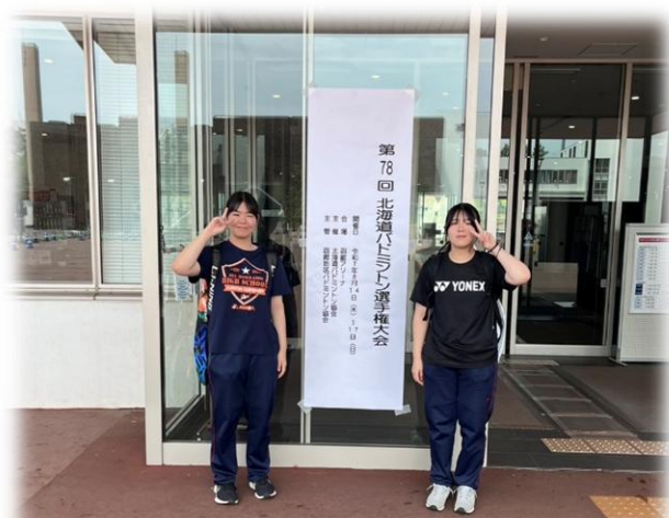
▲全道大会初出場のバドミントン部1年生の2人